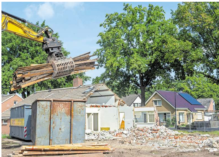
In het najaar van 2022 gingen veertig oude seniorenwoningen in Veenoord tegen de vlakte. De verwachting is dat de kavels op dit terrein volgend jaar in de verkoop gaan.