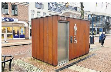
Het openbare toilet in de binnenstad van Assen.