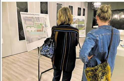
In 2022 presenteerde de gemeente plannen voor de nieuwbouw op de locatie van De Schalm in Nieuw-Amsterdam.

Plaatselijk ook wel bekend als het C-veld, een overbodig voetbalveld van Weiteveense Boys. Het plan is 21 woningen voor starters en senioren te bouwen. Twee vrijstaand, twee twee-onder-een-kap-ers en de rest in rijtjes. Stikstof is hier een groot probleem, het terrein ligt dicht bij het hoogveengebied Bargerveen. Daarvoor is nog geen oplossing in zicht, er lopen onderzoeken om te kijken hoe het vlottetrokken kan worden. Gaat het plan door, dan kunnen projectontwikkelaars